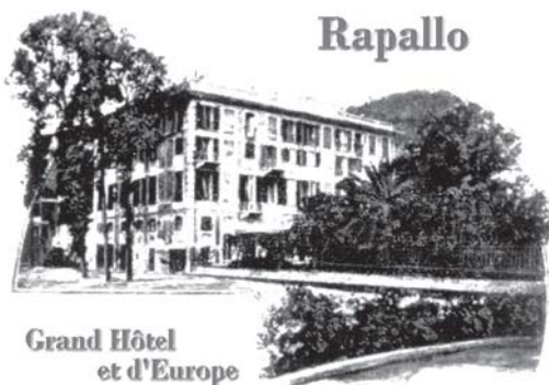
Grand Hôtel et d'Europe